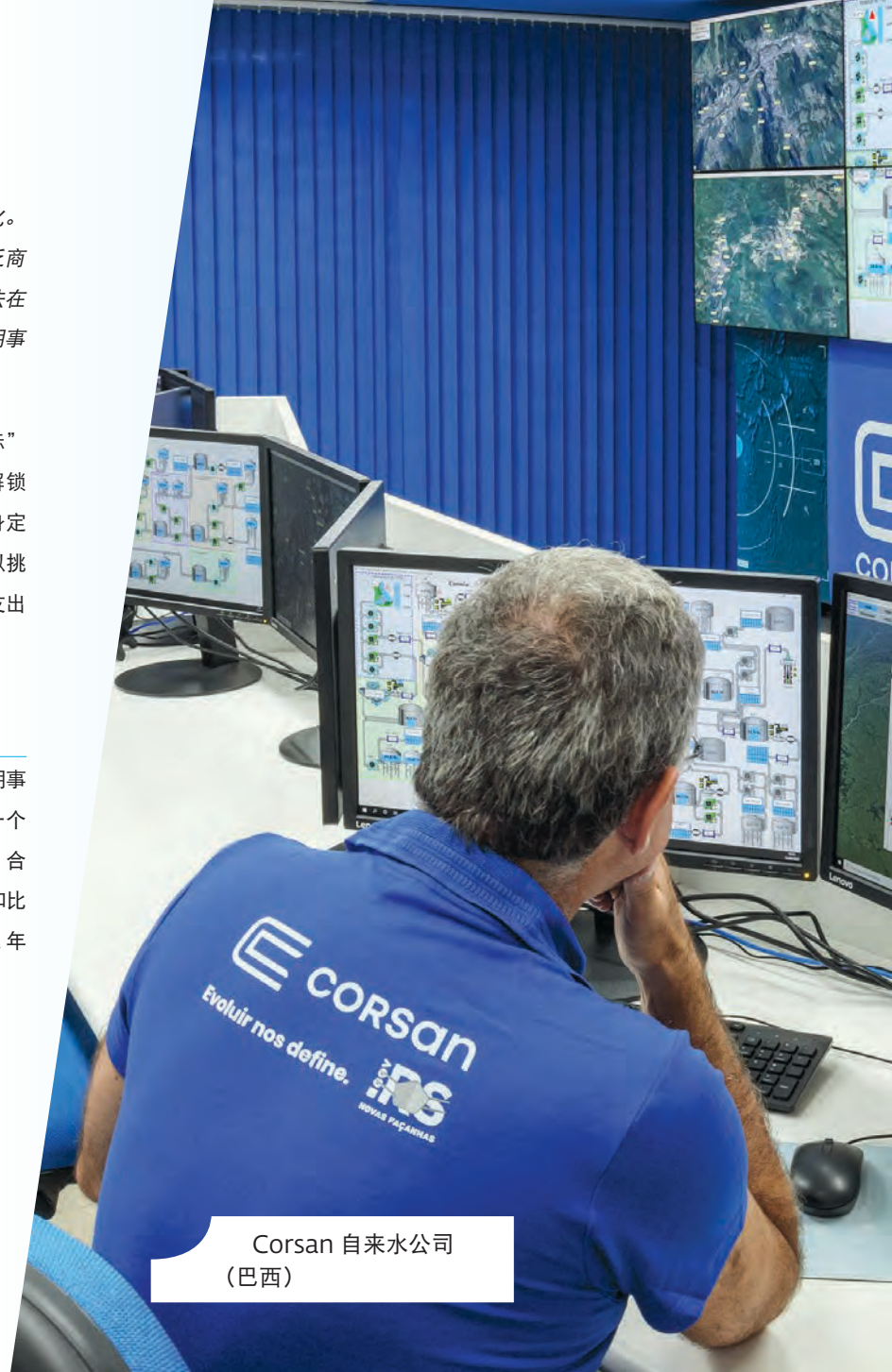
Corsan 自来水公司 (巴西)

U4C 倡议自 2021 年启动以来已向三个国家的五个公用事业公司提供了支持，促成了 2.38 亿美元投资。其中一个项目是与拥有 630 万客户的巴西自来水公司 Corsan 合作，帮助它制定计划，通过安装水表、更换老旧水泵和比重计等措施，将供水损失从目前的 44% 减少到 2024 年的 35%。该计划得到了 5800 万美元的贷款支持。