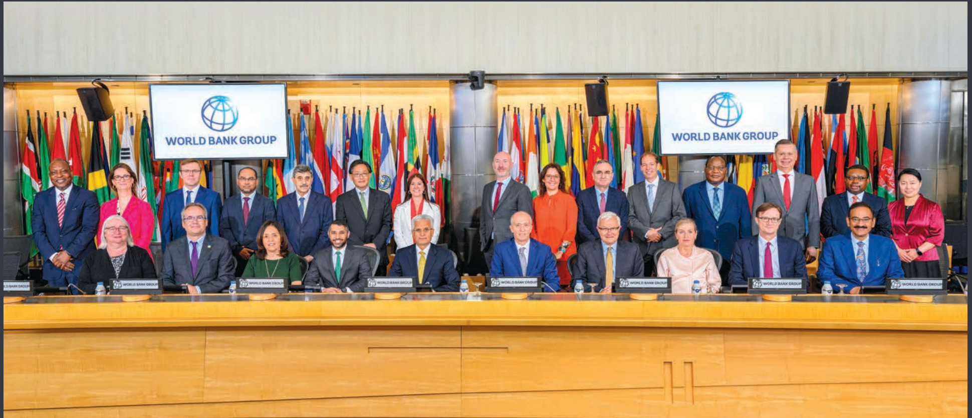
前排就座（从左到右）：