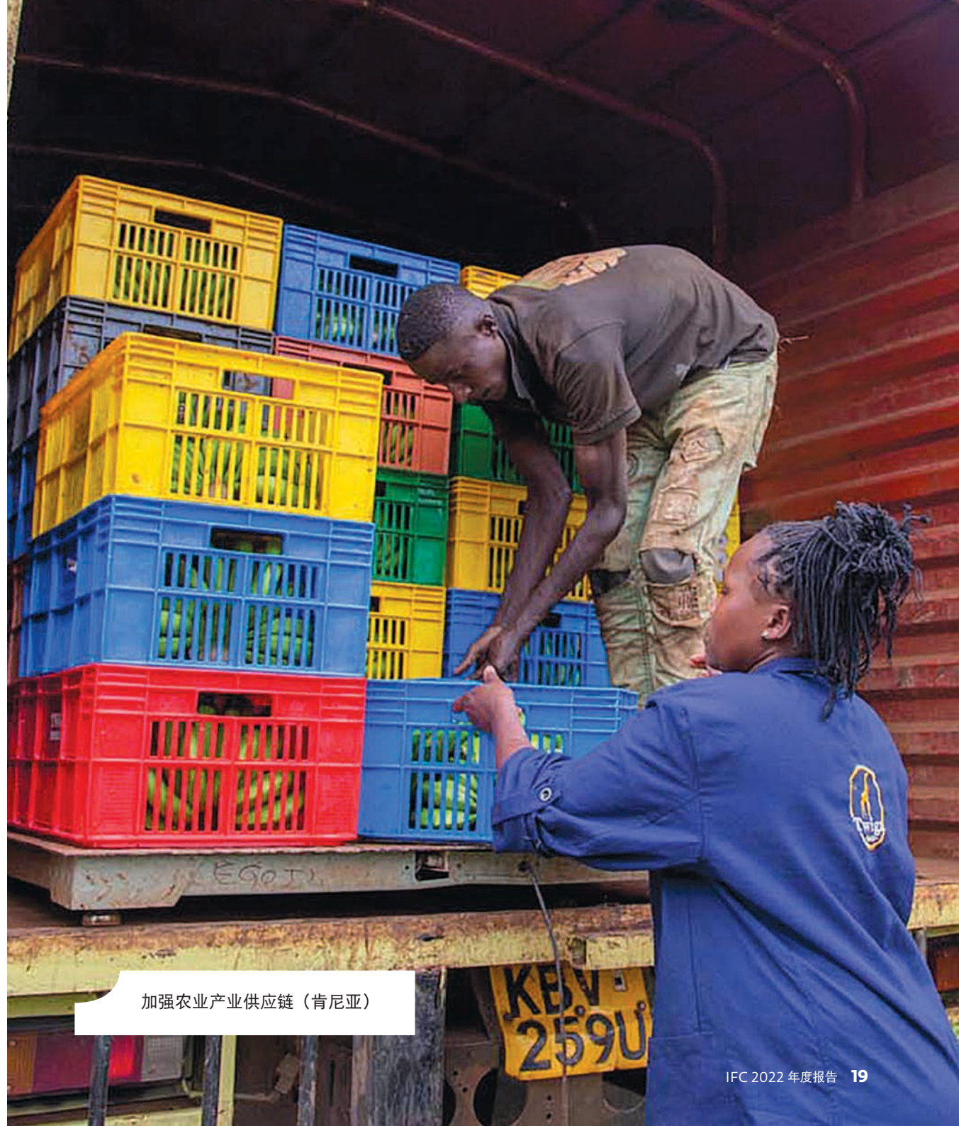
加强农业产业供应链（肯尼亚）

“我们与 IFC 有长期合作关系，因为我们都承担着推进非洲大陆发展的使命。靠着在 IFC 支持下获得的长期耐心资本，我们得以进入我们作为纯粹商业实体通常难以进入的领域。我们开始深入农村地区，为学校 and 医院提供网络服务，让年轻人能以更便宜的价格加入数字经济。”