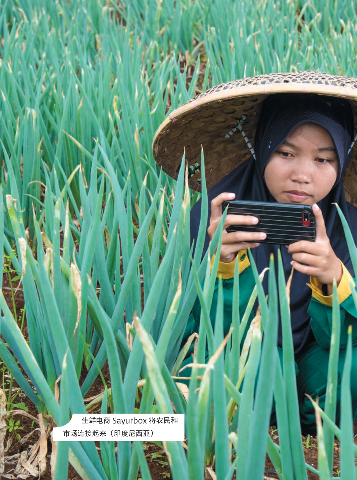
生鲜电商 Sayurbox 将农民和市场连接起来（印度尼西亚）